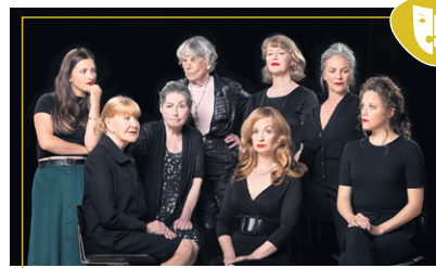
Huit femmes 26 février à 20 h

Les spectacles ont lieu au Théâtre Télébec. Billets en vente au ticketaccs.net ou à la bibliothèque municipale de Val-d'Or.