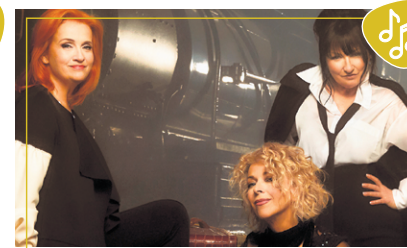
Pour une histoire d'un soir 10 mars à 19 h 30