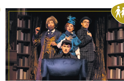
Sherlock Holmes - Le signe des quatre Dimanche 13 mars 15 h Du Théâtre Advienne Que Pourra Comédie pour la famille (dès 10 ans)