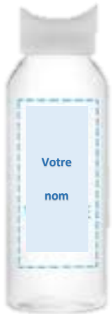
Identifier votre bouteille