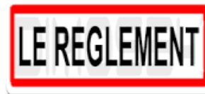
Quitter la chambre 15 minutes après l'activité