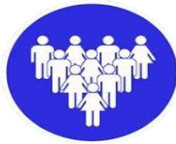
Dix personnes maximum par chambre